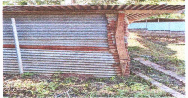
Las columnas del aula temporal ya se esta deteriorando.

Observación: Si es necesario se pueden agregar hojas adicionales y actualizar el número de hojas.