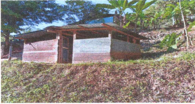
Este aula se apertura temporal en el año 2023, en ese momento la municipalidad nos dio un docente del nivel parvulos