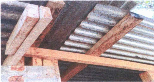
En relacion a la estrucutura del entechado, se encuentra en un deterio por en clima en nuestro medio.