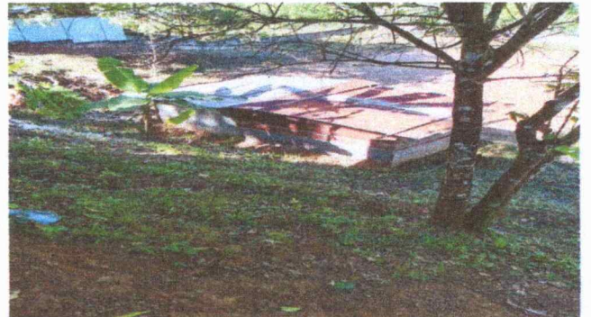
La estructura de la lamina esta en un estado deteriorado por las condicines climaticas.