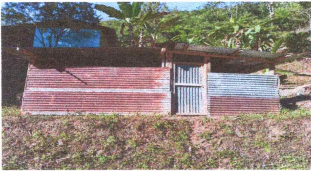
La estructura del aula tanto como puerta se encuentran en mal estado, por las condiciones climaticas.